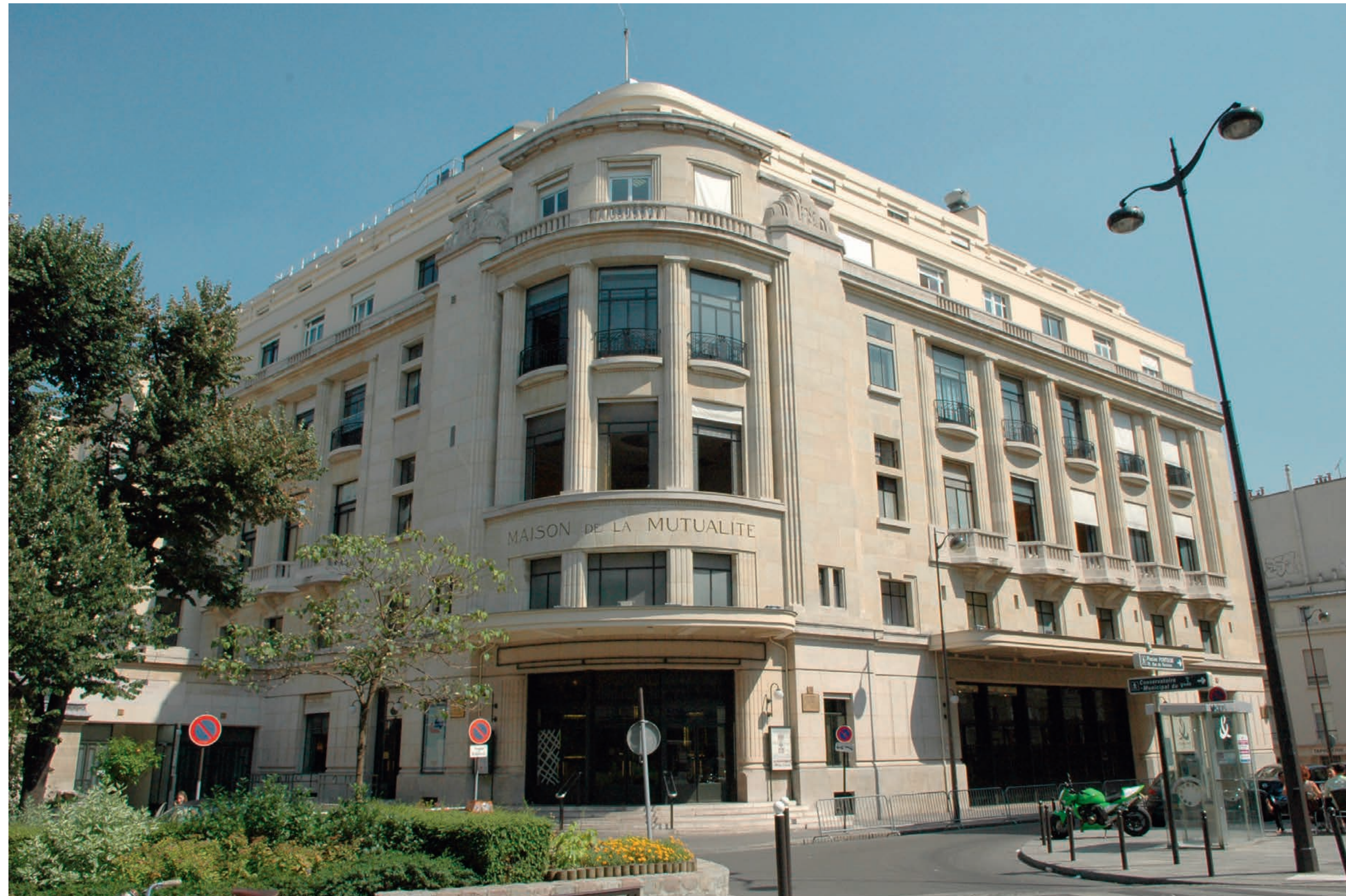
→ La Maison de la Mutualité à Paris